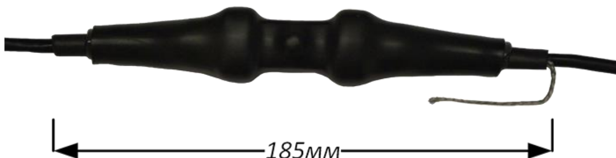
Рисунок 3. Герметичное подключение устройства защиты Commeng FEP-m f/f к кабелям с помощью монтажного комплекта КМЕ-2