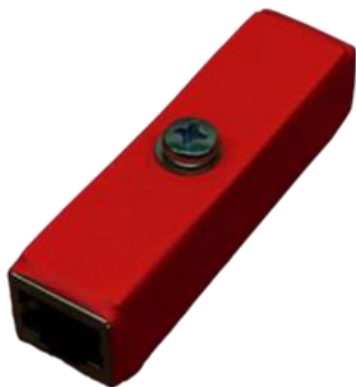
Рисунок 1. Внешний вид Commeng FEP-m f/f

Применяется для защиты оборудования с интерфейсами Ethernet 10/100 BASE-TX . Поддерживает передачу питания поверх данных в соответствии с рекомендациями IEEE 802.3af-2003 и IEEE 802.3at-2009 независимо от метода передачи питания, а также Passive PoE .